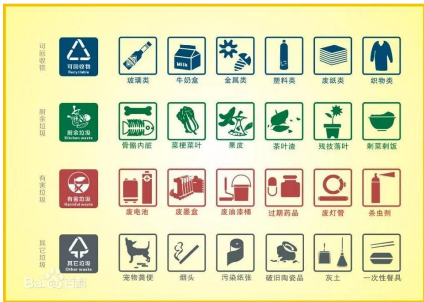
图 2-2 垃圾分类标准